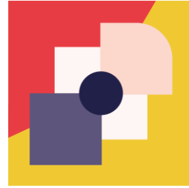
Métiers d'Art Styliste, mosaïste, maroquinier, etc.