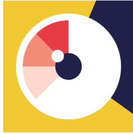
Arts visuels Photographe, illustrateur, plasticien, etc.

Un écosystème innovant qui rassemble et décloisonne les métiers du secteur